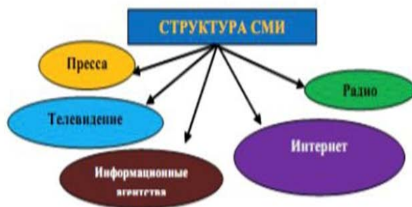
Рисунок 1. Структура СМИ

К наиболее значимым средствам массовой информации относятся: